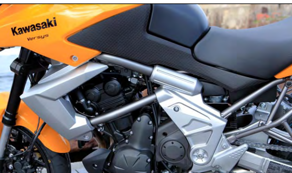
Nicht so super sind die metallifizierten Kunststoffabdeckungen am Rahmen.