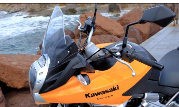
Das Windschild kann nach oben und nach vorne verstellt werden.