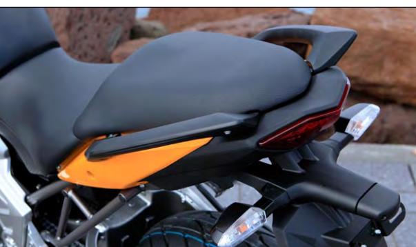
Deutlich besser sind die Sozi-Haltegriffe ausgefallen.

auf der Autobahn mit den Großen der Zunft ohne Probleme mitspielen. Klar, Tempi über 200 gehen nicht. Aber die sind sowieso selten genug angesagt. Meist pendelt sich die Reisegeschwindigkeit bei 150 km/h ein. Dann ist der Windschutz des neuerdings dreifach verstellbaren Plexiglasschildes noch ausreichend. Der nun mit einer zusätzlichen Gummilagerung im Rahmen verschraubte Motor dreht dabei im mittleren Bereich und begnügt sich mit einer moderaten Menge Kraftstoff. Ein Durchschnittsverbrauch von knappen 5 Liter auf, insgesamt über 4.000 Testkilometern generierte stets über 300 km lange Tankintervalle aus dem 19 Liter fassenden Spritbehälter, ohne, dass auch nur einmal die Reservelampe in Erscheinung trat.