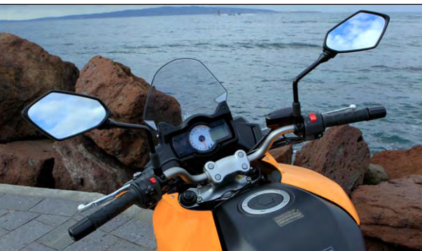
Endlich mal ein Bike mit serienmäßig guter Rücksicht!