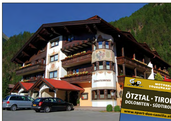
Don Camillo/Haus Christophorus und die hauseigene Touren-Karte