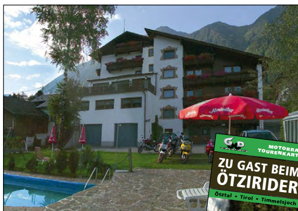
Hotel Gasthof Post und die hauseigene Touren-Karte

Hier kann man erleben, wie es diese prähistorischen Menschen überhaupt ohne Motorrad ausgehalten haben. Ein echtes Naturerlebnis liefert auch der Stuibenfall ganz in der Nähe. Fast 160 m tief stürzen hier die Wassermassen senkrecht nach unten und bieten ein imposantes Spiel. Natürlich kann man hier in den Ötztaler Gemeinden einfach nur mal in Ruhe genießen und den Tag nach einer unvergesslichen Motorradtour gemütlich ausklingen lassen.